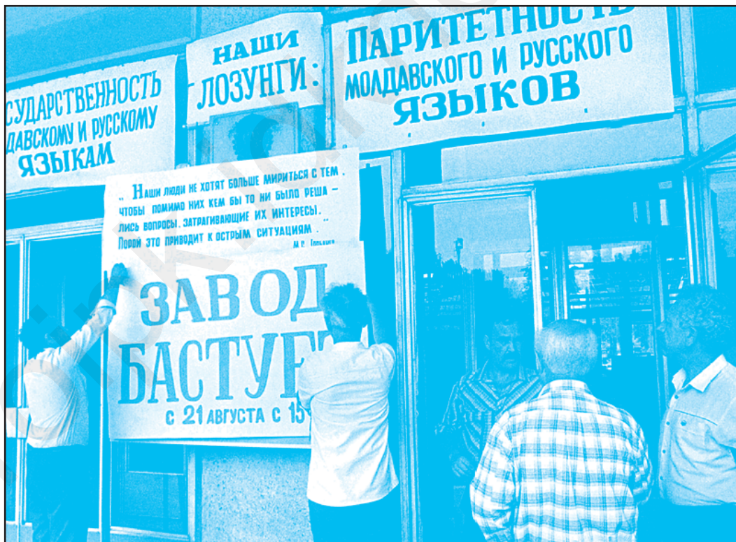
Страйк у Тирасполі. Серпень 1989 р.