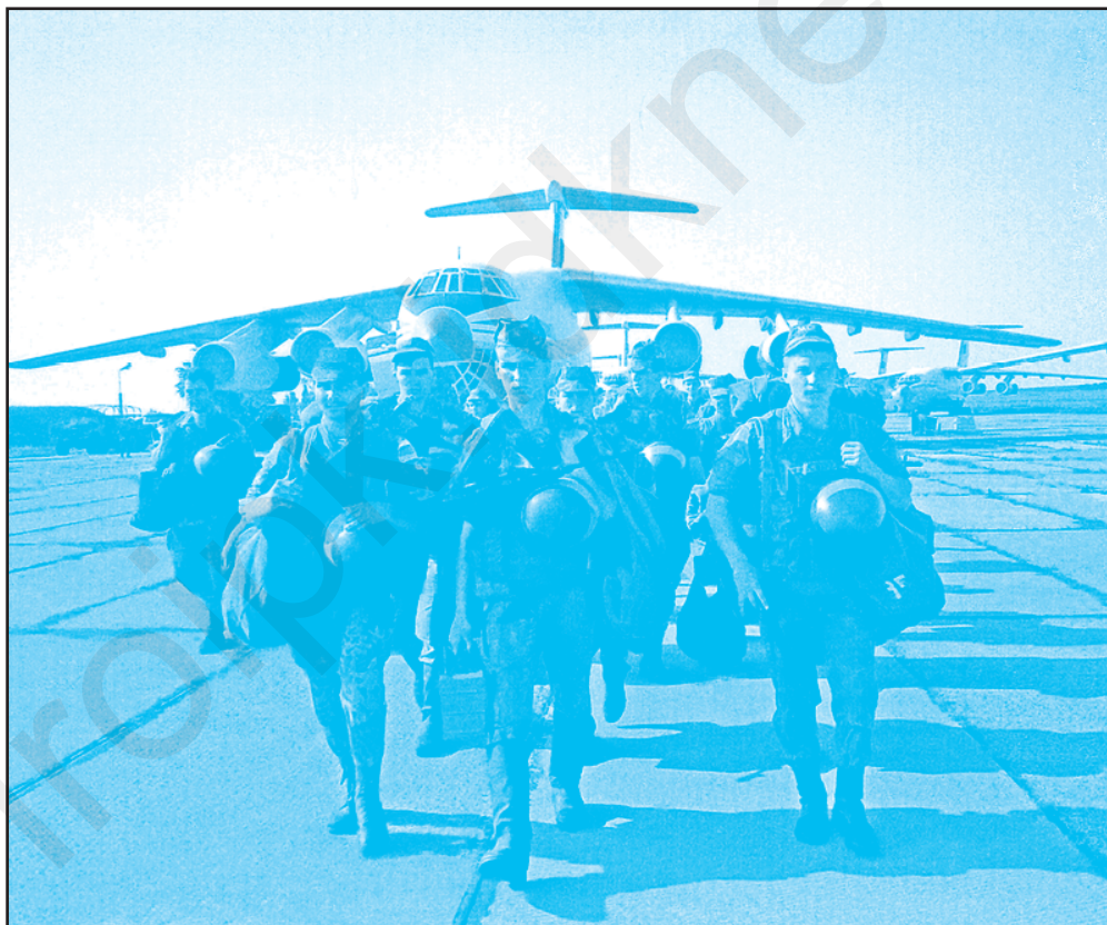
Висадка російського миротворчого контингенту. Липень 1992 р.