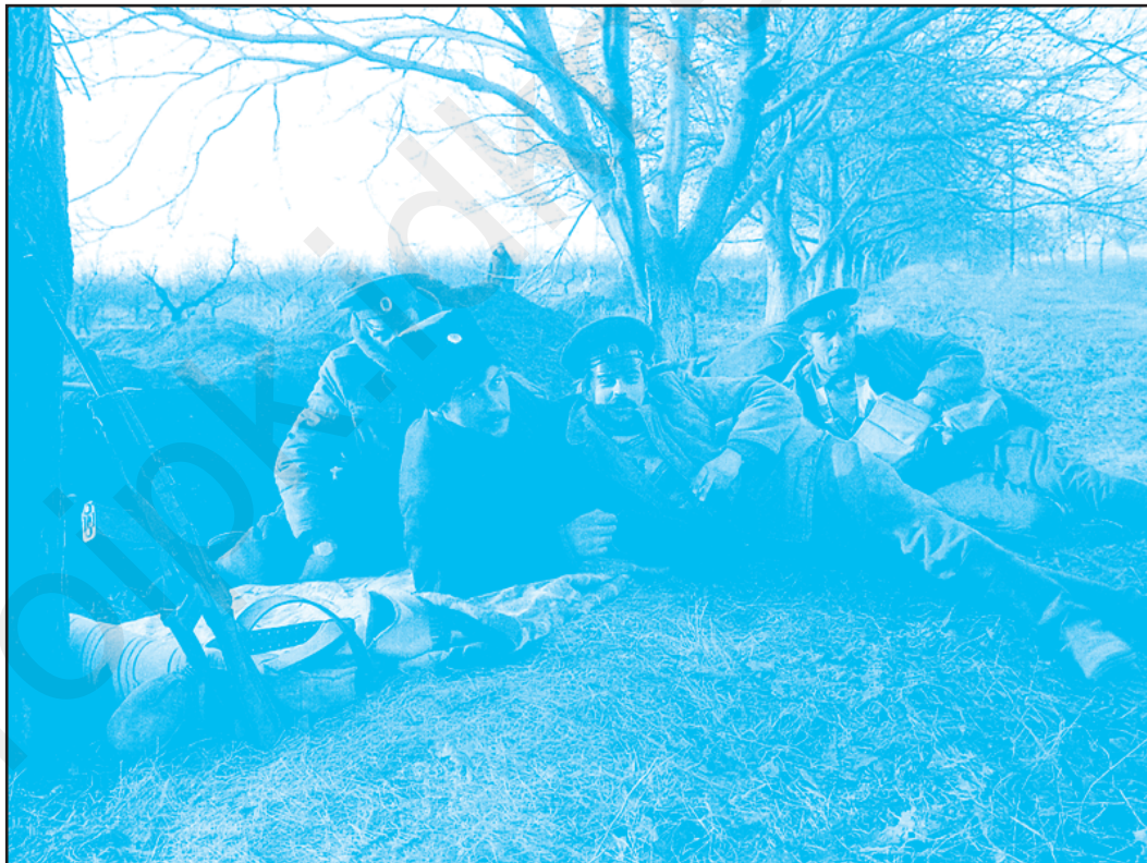
Козаки на позиціях біля с. Дороцьке. Весна 1992 р.