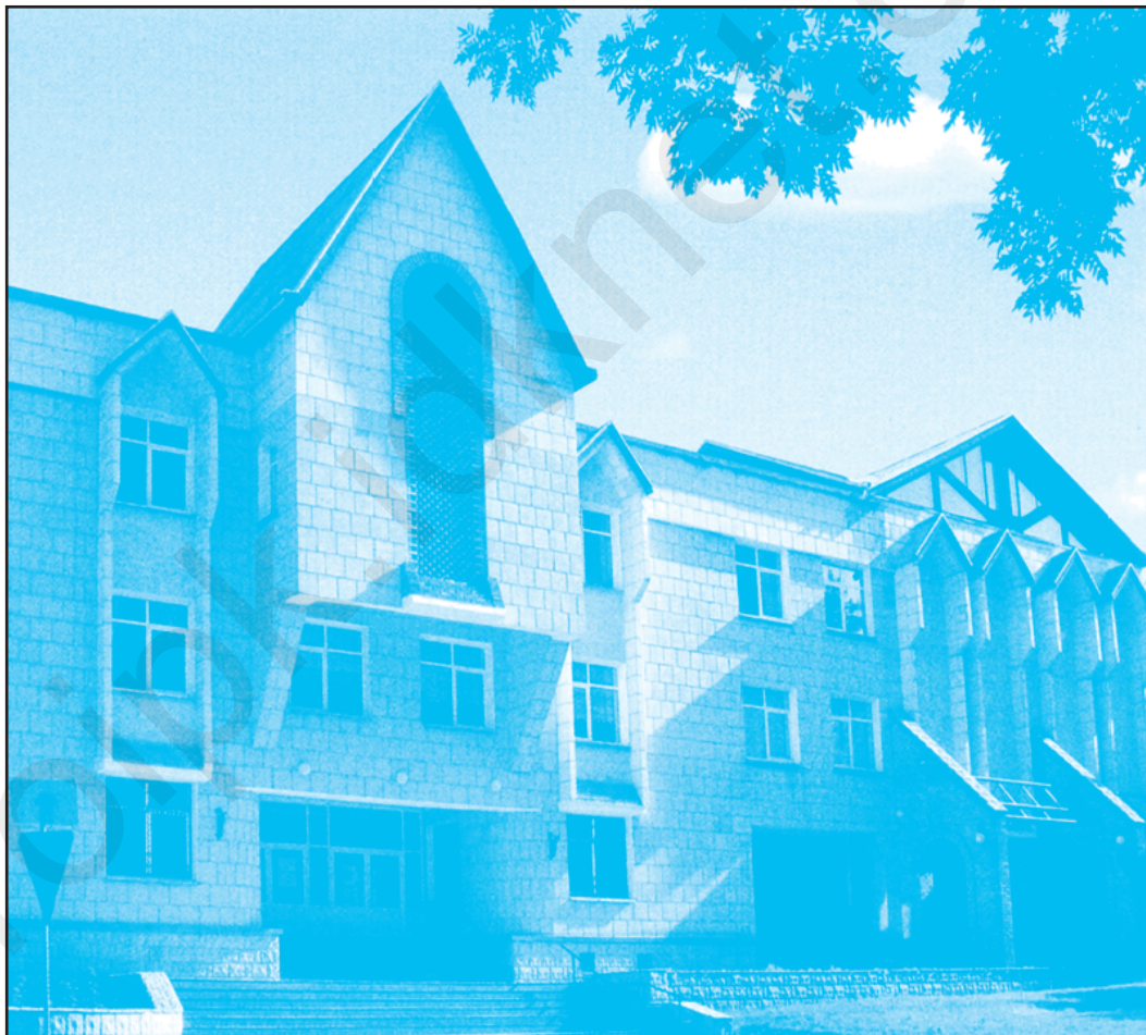
Дитяча художня школа ім. О.Ф. Фойницького в Тирасполі. Збудована у 2004 р.