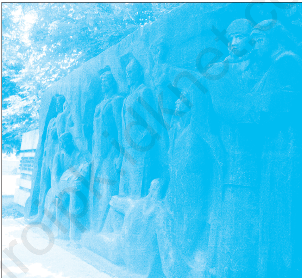
Скорботна стіна «Чорна огорожа» біля будівлі Бендерського депо – місце розстрілу мешканців міста румунськими окупантами