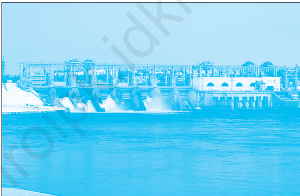
Гребля Дубоссарської ГЕС. Введена в експлуатацію у 1954 р.