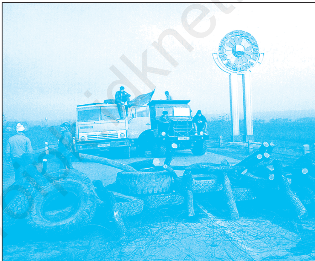
Барикада на Дубоссарському мості. Жовтень 1991 р.