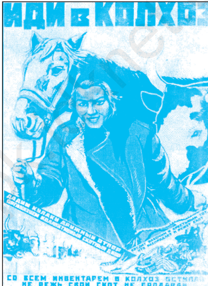
Популярний у МАРСР плакат періоду колективізації. 1929 р.