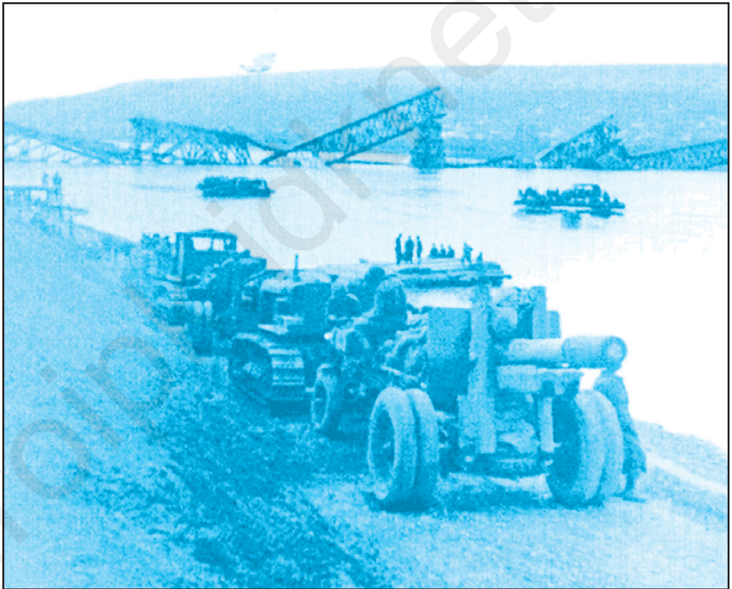
Форцяря Ниструлуй де кэтре трупеле советиче ын апропиеря Рыбницей. Априлие 1944