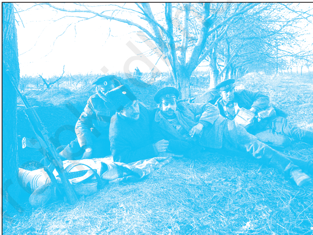
Казачий пе позицииле де лынгэ с. Дороцкая. Примэвара анулуй 1992