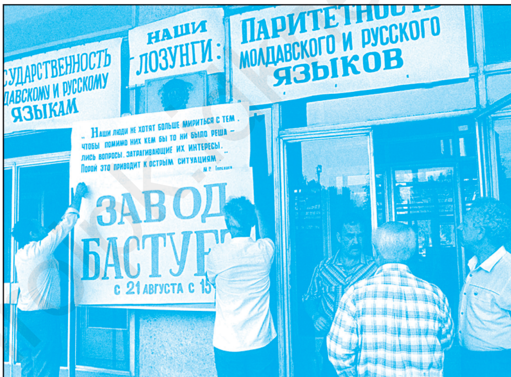
Грева дин Тираспол. Аугуст 1989