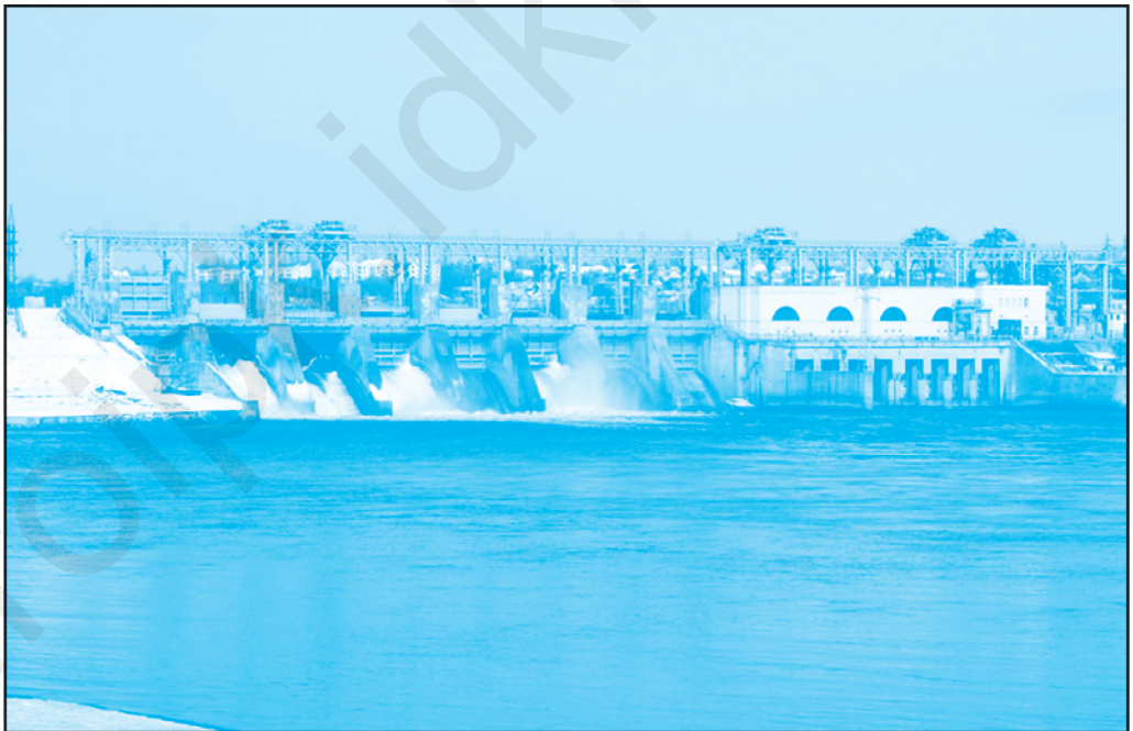
Баражул Централей гидроелектриче дубэсэрене. А фост датэ ын експлоатаре ын анул 1954.