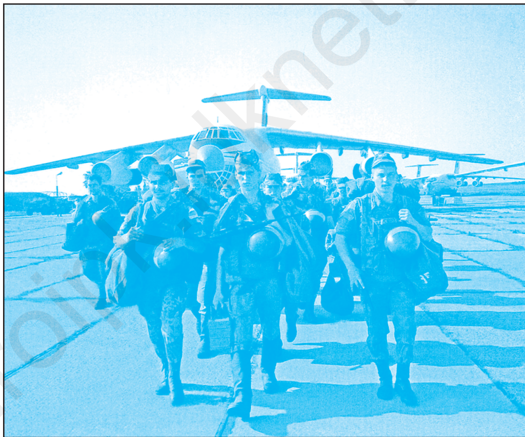
Добаркара контингентулуй русе де менцинере а пэчий. Юлие 1992