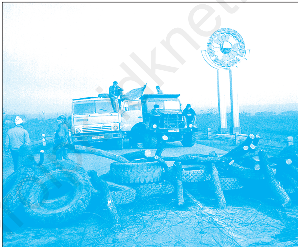
Барикада де пе подул де ла Дубэсарь. Октомбрие 1991