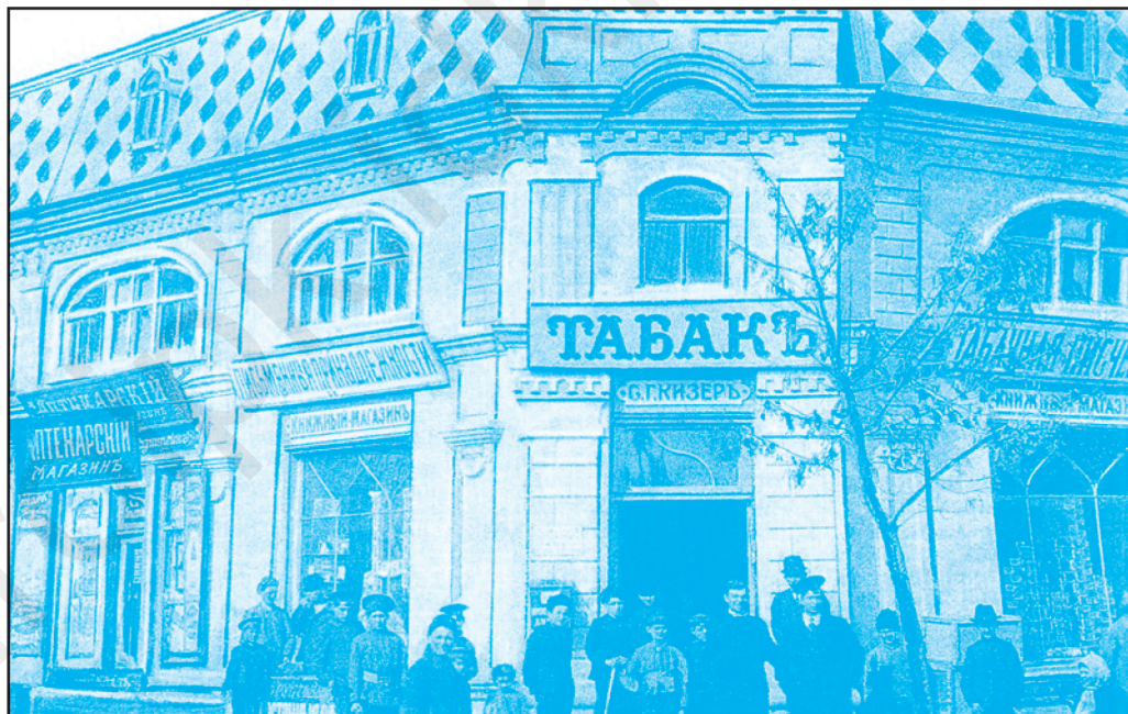
ор.Тираспол, ст. Базарная. Ынчепутул секолулуй ал XX-ля