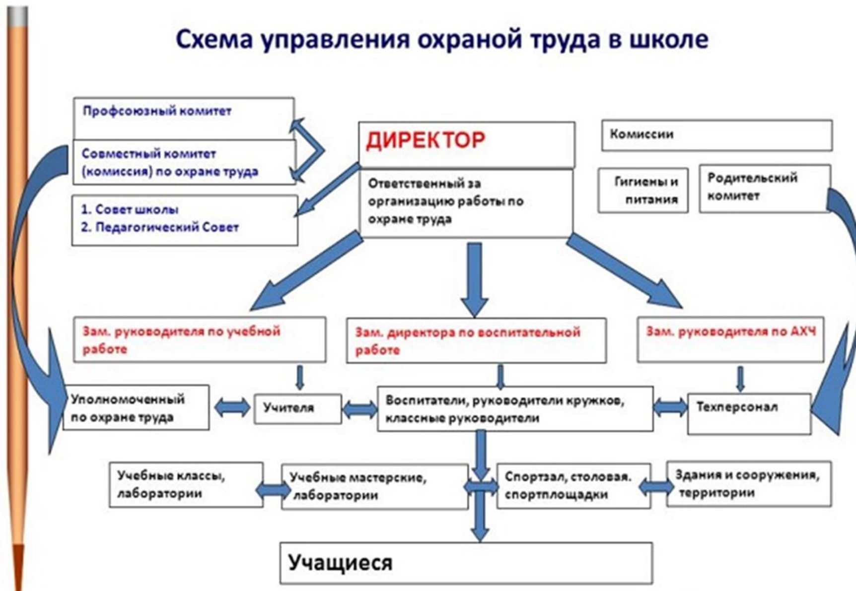
Схема управления охраной труда в школе