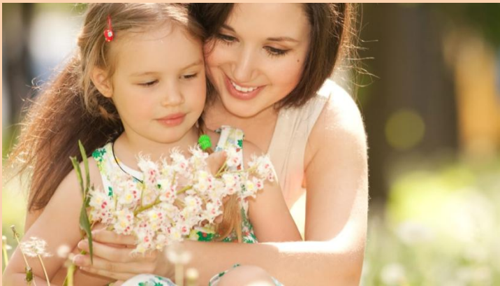
Мама (ненька, мати), донька (дочка)