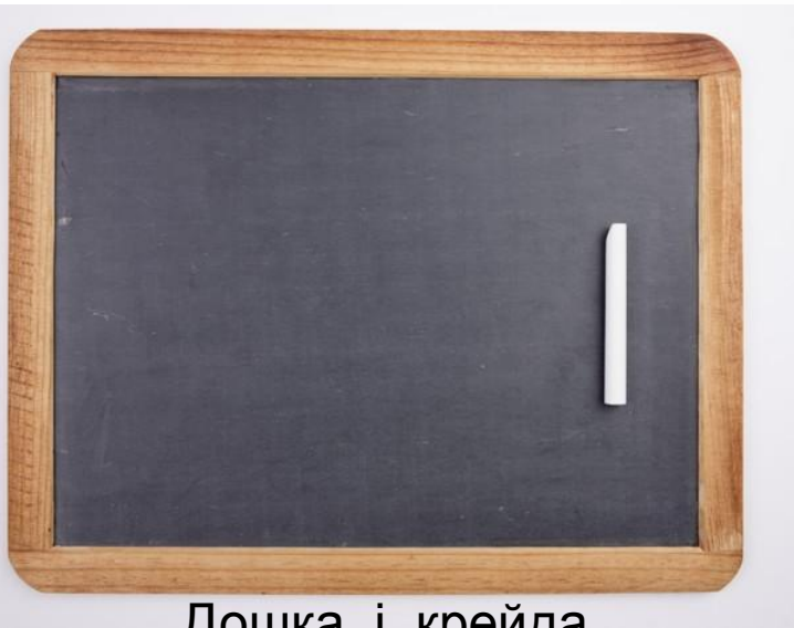
Дошка і крейда