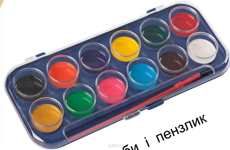
Фарби і пензлик