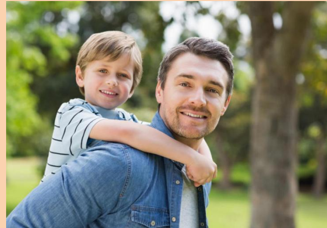
Батько (тато), син