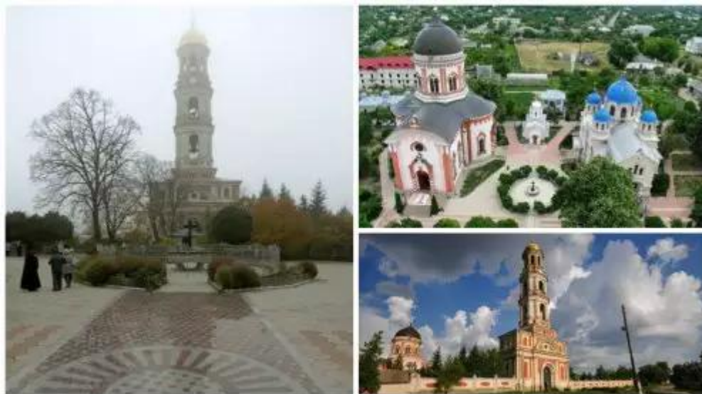
(Ново-Нямецкий Свято-Вознесенский монастырь в селе Кицканы)

66. Ансамбль какого известного мужского монастыря на территории Приднестровья представлен на фотографии?