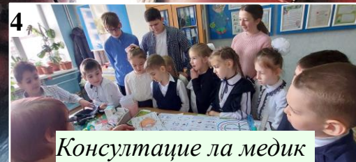
Консултацие ла медик