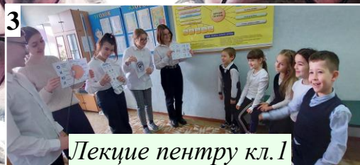
Лекцие пентру кл.1